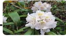
ハクサンシャクナゲ