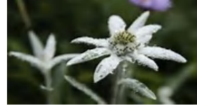
ハチネウススキリョウ